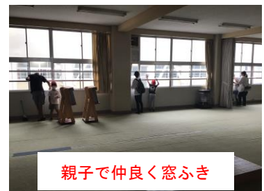
親子で仲良く窓ふき

当日は、子どもたちと一緒に活動していただき本当にありがとうございました。子どもたちも本当にうれしそうでした。