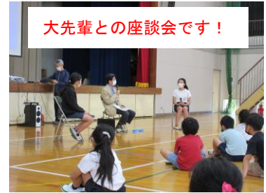
大先輩との座談会です！